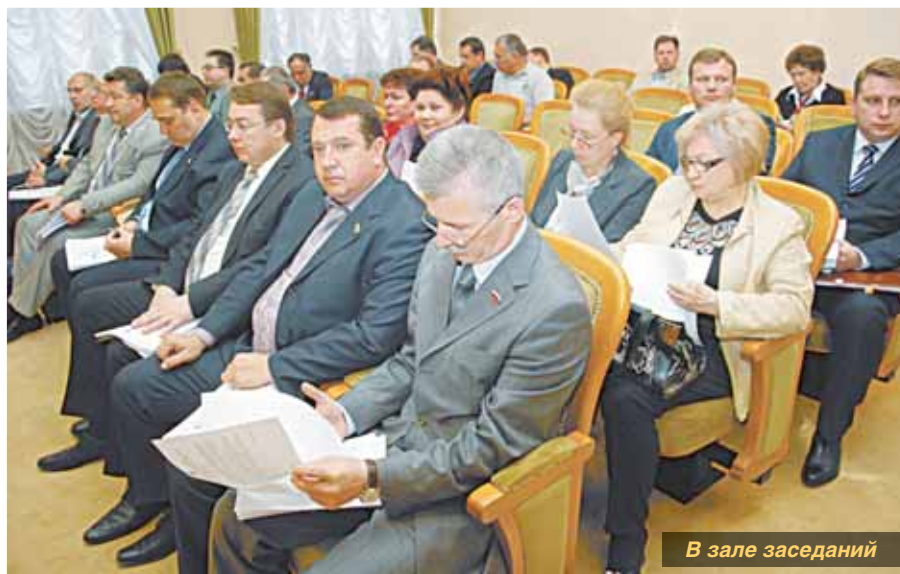
В зале заседаний