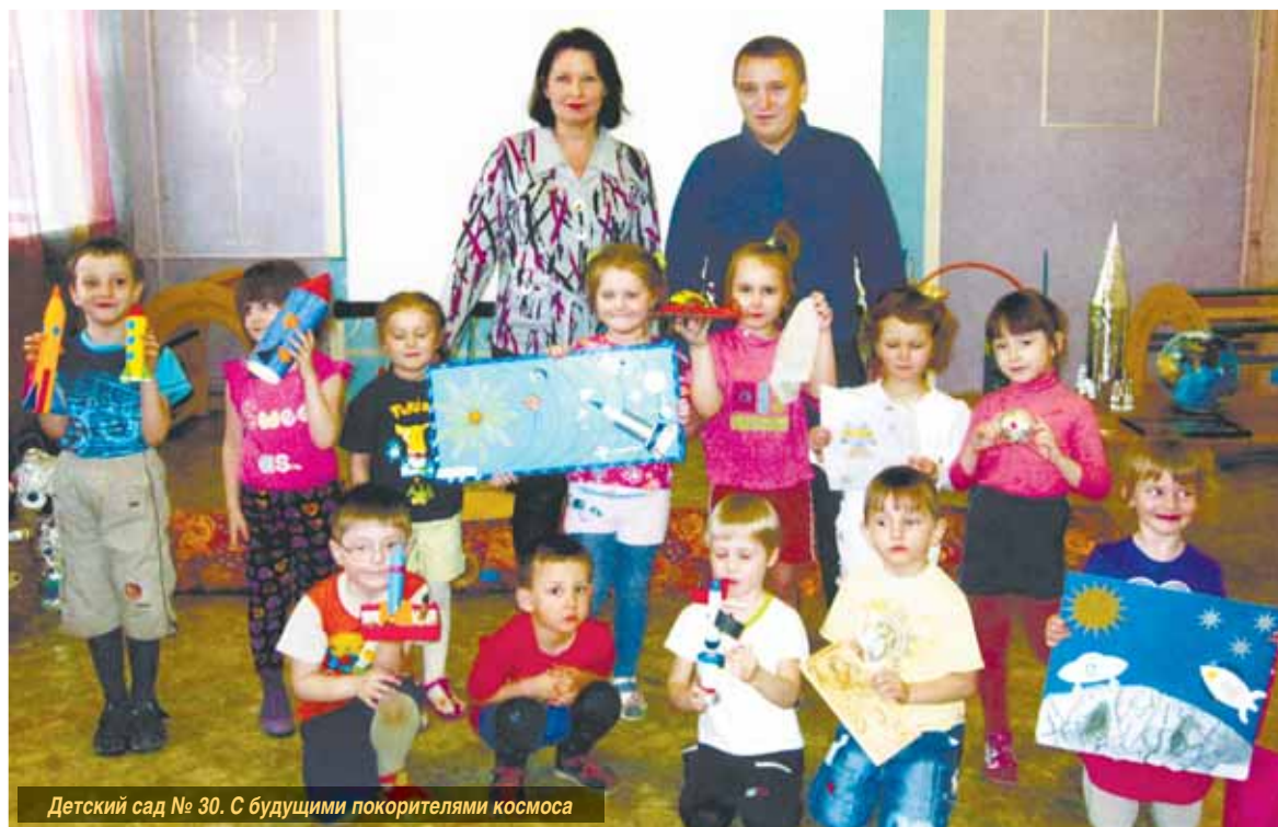
Детский сад № 30. С будущими покорителями космоса