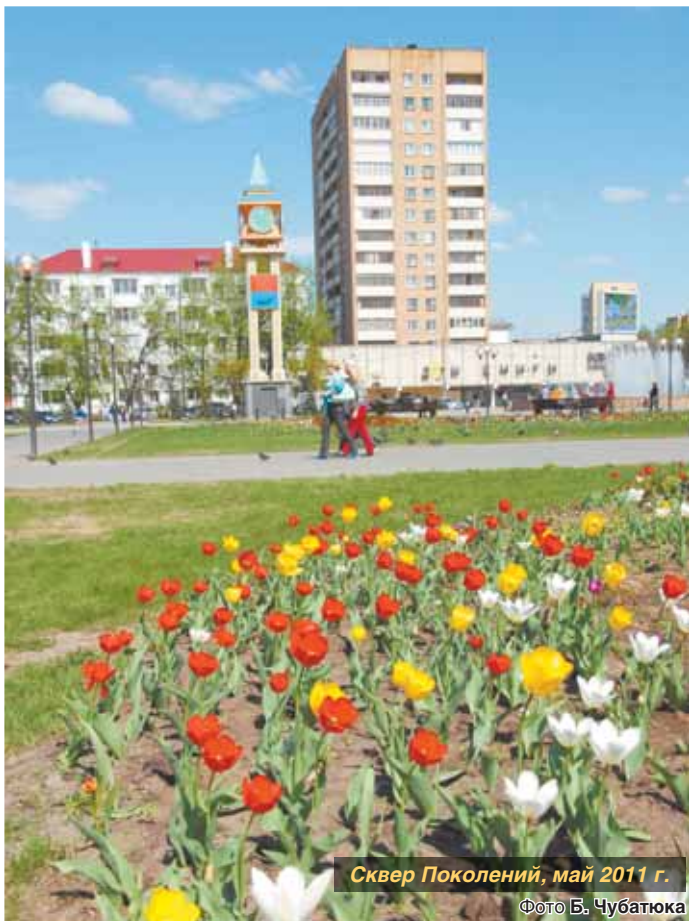
Сквер Поколений, май 2011 г.