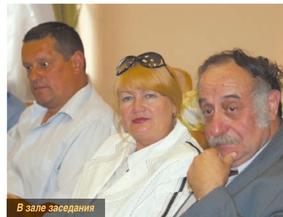
В зале заседания

Обозначенные проблемы определили приоритетные направления совершенствования существующей системы дошкольного образования и идео-