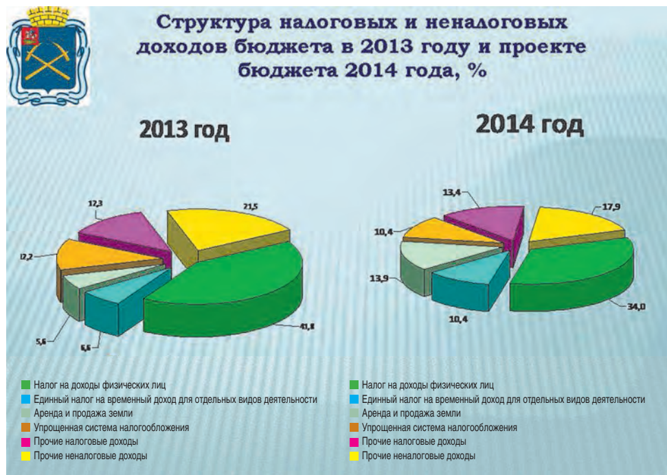
СТРУКТУРА НАЛОГОВЫХ И НЕНАЛОГОВЫХ ДОХОДОВ БЮДЖЕТА ГОРОДСКОГО ОКРУГА ПОДОЛЬСК В 2013 ГОДУ И В ПРОЕКТЕ БЮДЖЕТА НА 2014 ГОД И НА ПЛАНОВЫЙ ПЕРИОД 2015 И 2016 ГОДОВ

Основные приоритеты расходов бюджета городского округа Подольск в 2014-2016 годах определены с учетом необходимости