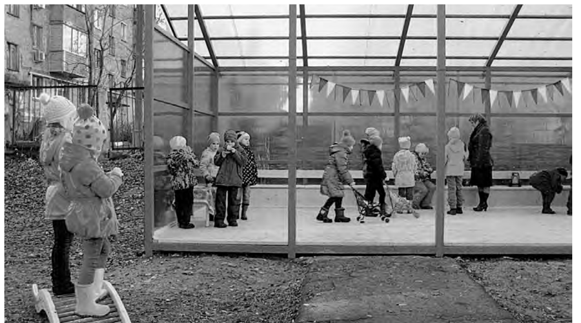
Воспитанники детского сада № 52 «Калинка» на прогулке под новым тентовым навесом.